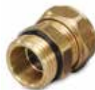
VDA100 Наружная резьба

Сливные клапаны ESBE для котлов, баков горячей воды, трубопроводов и т.д. Открываются автоматически при подсоединении ниппеля со сливным шлангом.