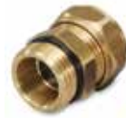
VDA100 Наружная резьба

Сливные клапаны ESBE для котлов, баков горячей воды, трубопроводов и т.д. Открываются автоматически при подсоединении ниппеля со сливным шлангом.