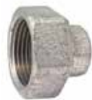
КТВ100 внутренней резьбой

ESBE комплект присоединений с накидной гайкой для клапанов с внешней резьбой. В одном комплекте одно подключение.