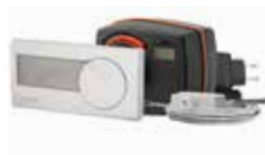
CRD122 Wireless, timer

17053100 __CRA911 Sensore del tubo di mandata, cavo da 5 m