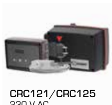
CRC121/CRC125 230 V AC

17053100 _____ CRA911 Sonde de départ, câble de 5 m 98100690 _____ Contact auxiliaire Série 90