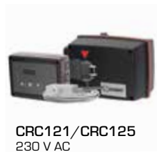
CRC121/CRC125 230 V AC

Арт. номер 17053100 _____ CRA911 Датчик подающего трубопровода, кабель длиной 5 м 98100690 _____ Вспомогательный выключатель серии 90