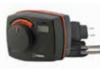
CRA141 230 В переменного тока

Серия ESBE CRA140 представляет собой комбинированный контроллер постоянного уровня температуры и контроллер температуры обратного потока со встроенным приводом. Продукция специально разработана для систем, в которых необходимо регулировать две температуры потоков теплоносителя.