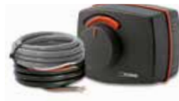
3-bodovým, přídavný spínač